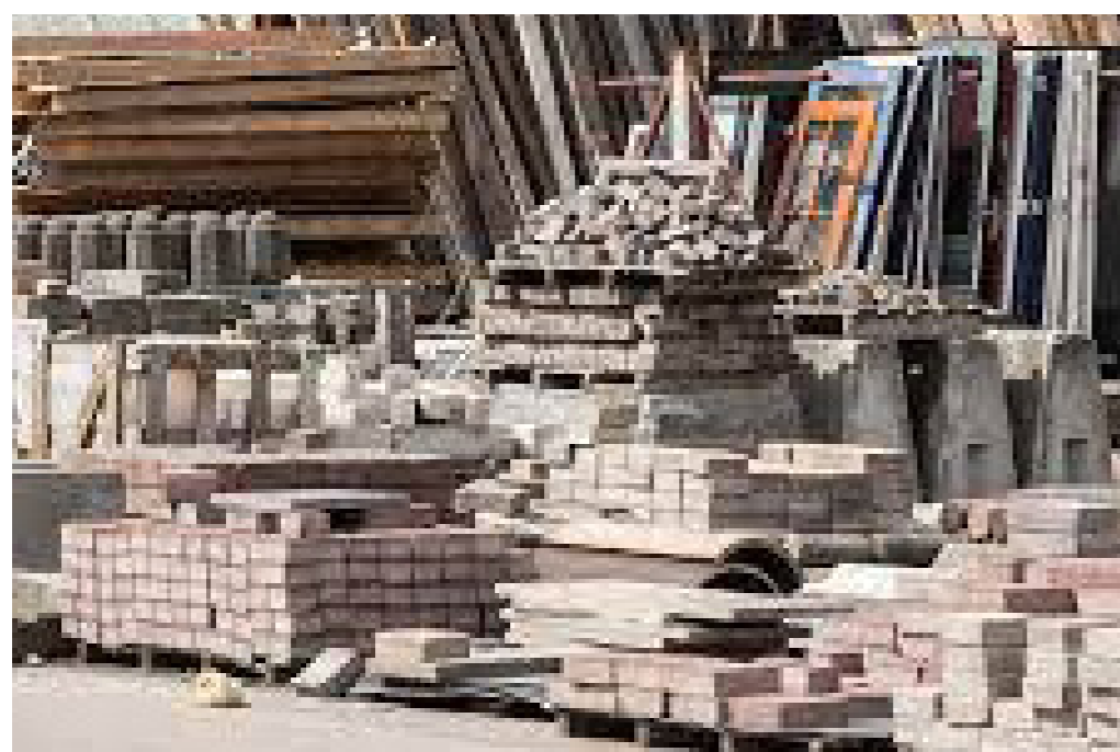
Hergebruik van bouwmaterialen