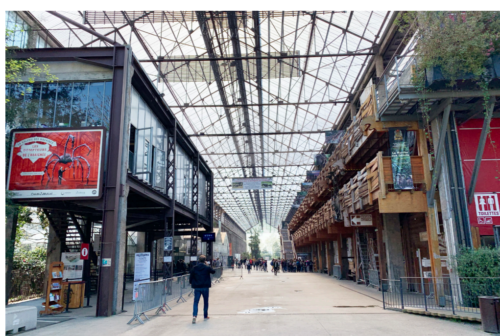
Hergebruik van bouwconstructies