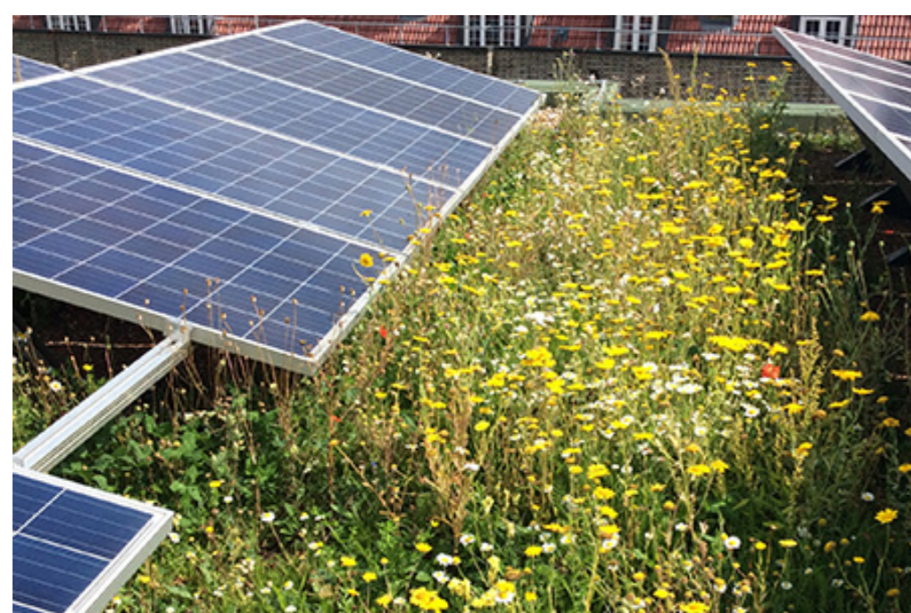
Zonnepanelen op de daken

Haveland wordt een warmteleverende wijk. Bij de ontwikkeling van Haveland is een veilige, gezonde en groene leefomgeving belangrijk. Negatieve milieuvloeden worden zo veel mogelijk ingeperkt en wordt gekeken op welke wijze circulaire gebiedsontwikkeling kan bijdragen aan de duurzaamheidsambities van Rheden en Haveland.