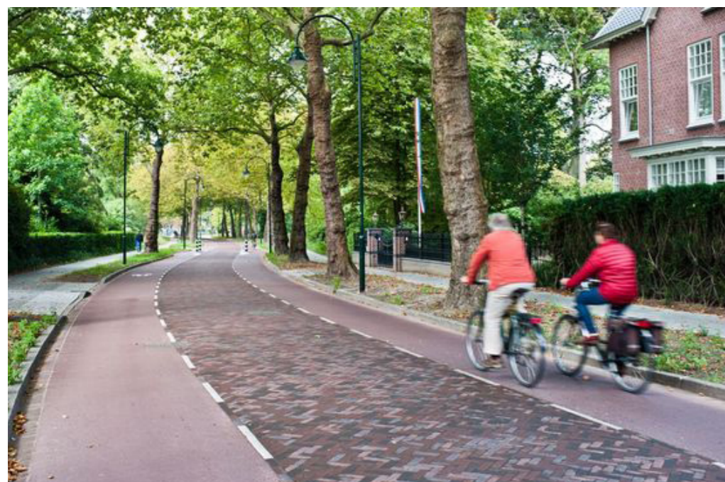
Fietsnetwerk in het groen

In Haveland wordt ingezet op gezonde en duurzame mobiliteit. De wijk wordt voornamelijk het domein van de voetganger en fietser. Een groot deel van de wijk is autoluw. Voorzieningen, werk en het OV (station en bushalte) zijn op loop- en fietsafstand. Hierdoor kent Haveland een lagere autoafhankelijkheid en mede door de inzet van onder andere deelmobiliteit een lager autobezit en gebruik.