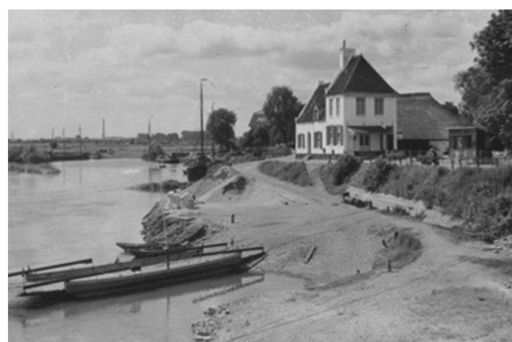
Het veerhuis in 1948