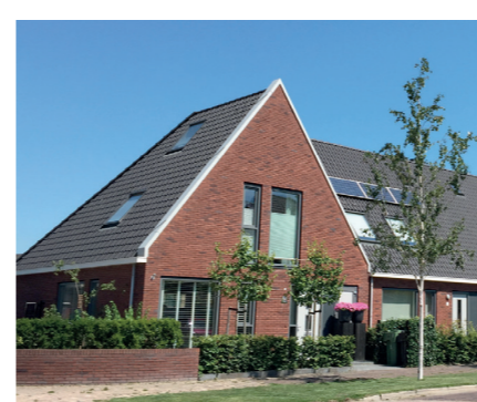
De Draai, Heerhugowaard