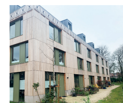
Hortus Ludens, Nijmegen